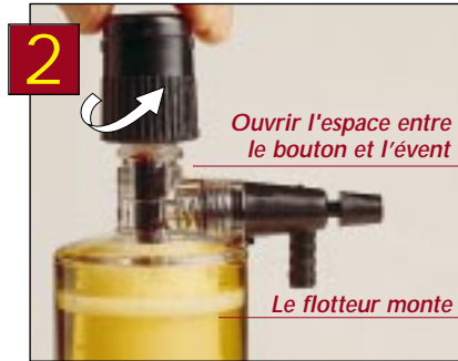
Großer Abstand zwischen dem Knauf und der Entlüftungsöffnung Schwimmer hebt sich

Lüften Lüften Sie das Gerät. Warten Sie einige Sekunden, bis sich der Schaum gelegt hat und lüften Sie dann erneut, wobei Sie darauf achten sollten, daß die Kammer generell mit Bier gefüllt ist.