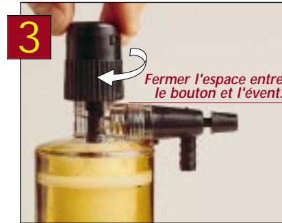
Kleiner Abstand zwischen Knauf und Entlüftungsloch

Aufdrehen: Drehen Sie den Knauf entgegen dem Uhrzeigersinn bis er au einem Halt kommt .